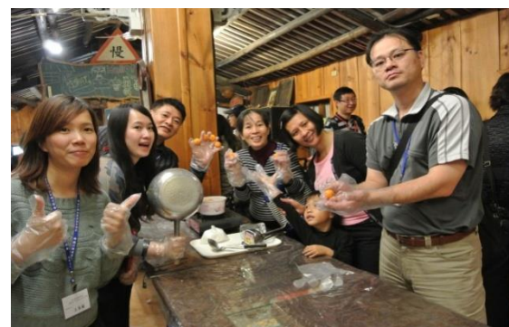
製作金桔果醬好健康