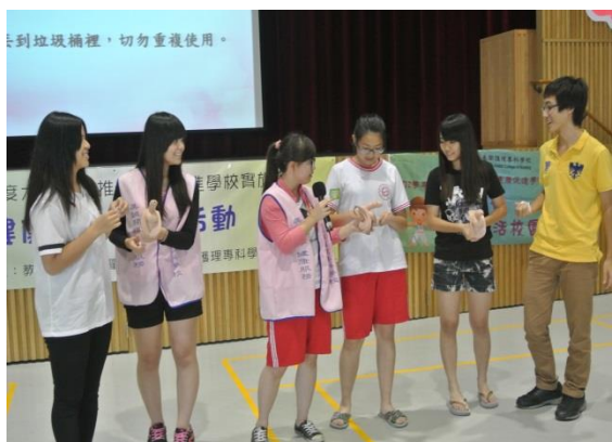
講解保險套使用時機及技巧