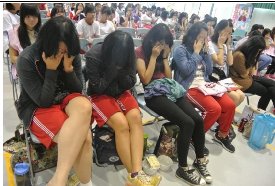
視力保健-眼壓按摩