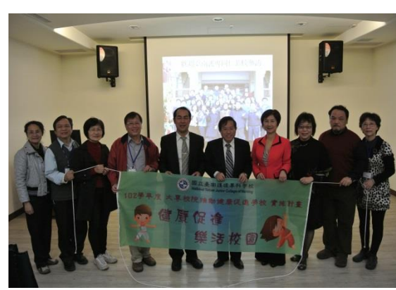
與中正大學長官合照