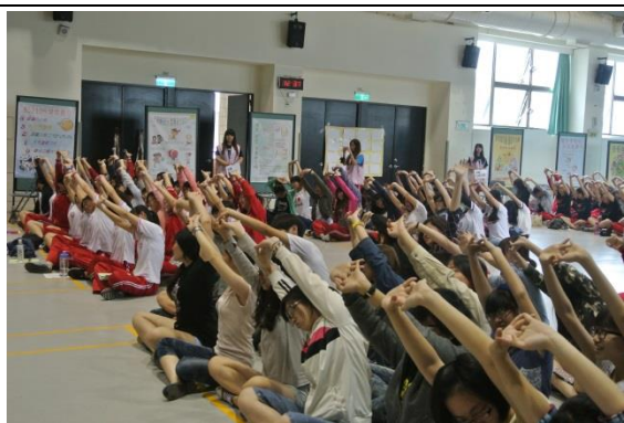
講師帶領大家一起做健康操