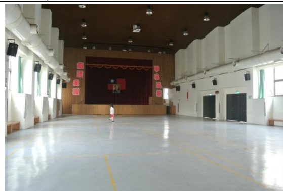
D棟4樓活動中心兼羽球場地