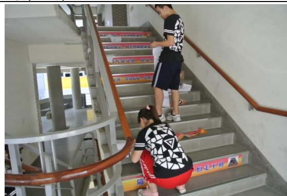
學生參與樓梯創意佈置