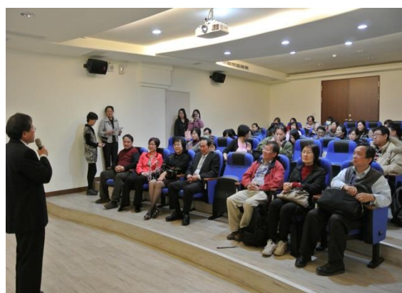
校長帶領同仁參訪中正大學

活動名稱：中正大學健康促進典範學校校外參訪 時間：103年01月28日 地點：中正大學