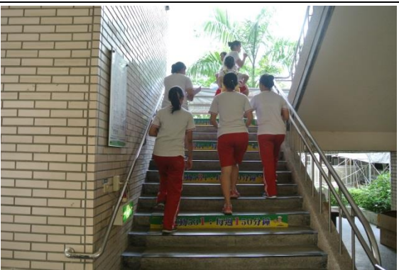
D棟樓梯-爬樓梯兼吸收健康知識