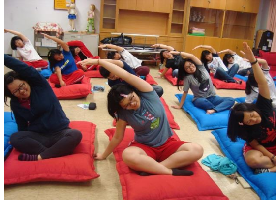
動一動，流汗好健康