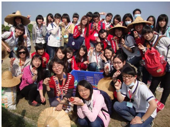
解說人員帶領參訪