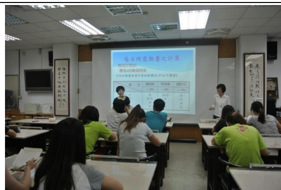
營養學介紹卡路里計算