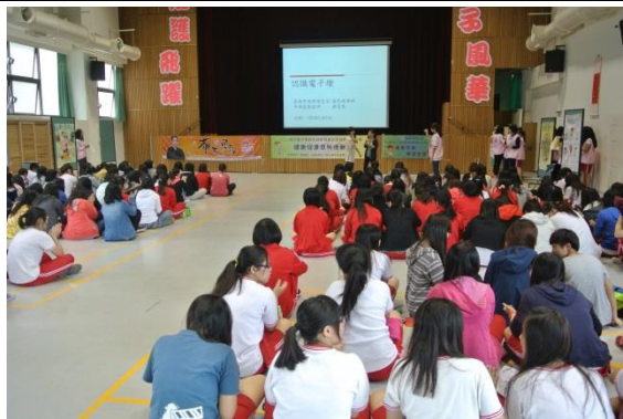
認識電子煙專題演講