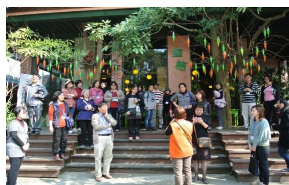
解說人員帶領參訪