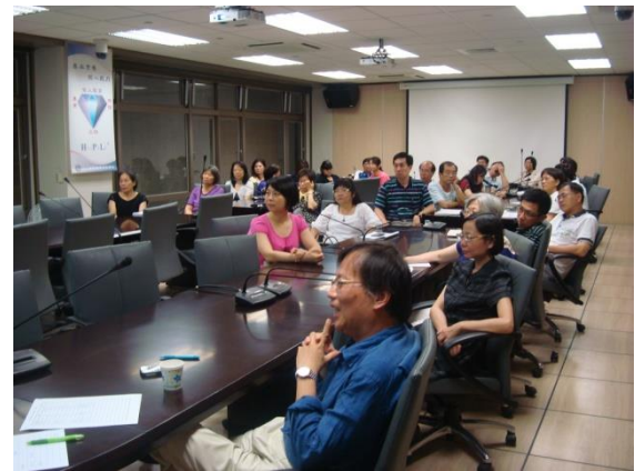
性教育相關輔導知能研習