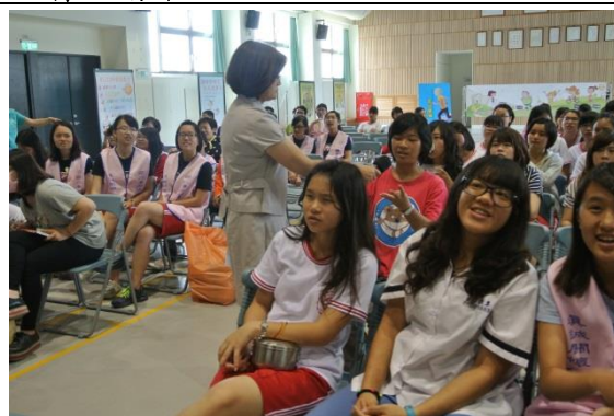
同學踴躍參與有獎徵答