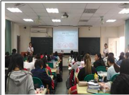
3-1 愛滋病防治入班宣導