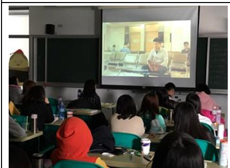
3-7 愛滋病防治影片賞析與討論