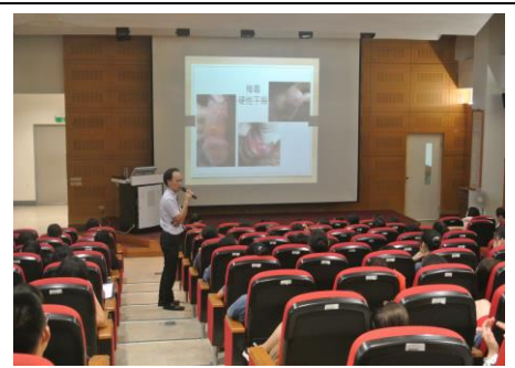
3-3 愛滋病防治專題演講