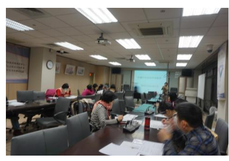
3-6 導師知能研習-校園性教育