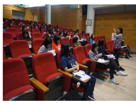
3-5 衛生股長會議宣導愛滋防治