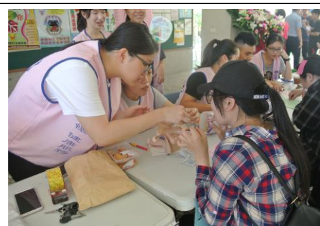
3-9 校慶推廣防治知識