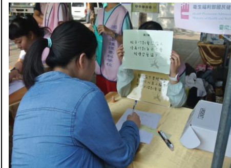
3-4 運動會-愛滋知識大會考