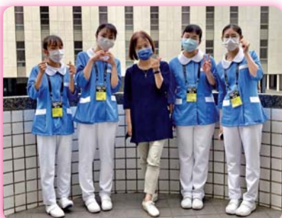
▲ 技能競賽選手與指導教師合影