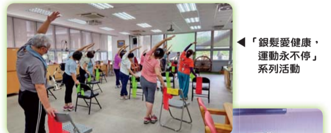
◀ 「銀髮愛健康，運動永不停」系列活動