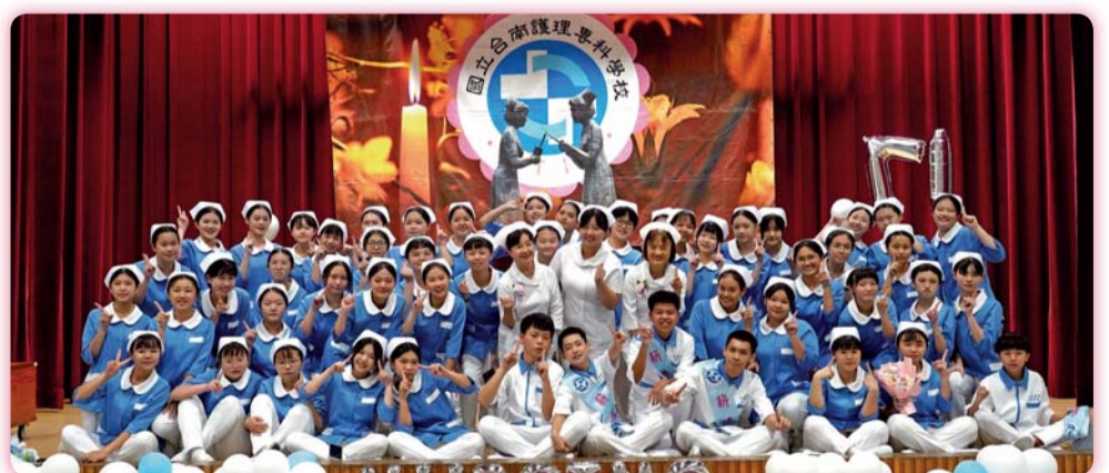
▲ 二年1班加冠生合影

而師長導引傳光給學生，象徵護理專業知識、技能與素養的薪火相傳，並將愛與關懷傳遞給身邊的每個人，藉此祝福本屆加冠學生在暑假的基本護理學實習順利、充實。