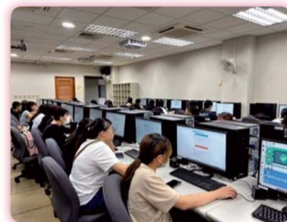
▲ 學生操作平臺進行測驗

【實習就業組】辦理112學年度畢業生大專院校就業職能平台（UCAN）測驗，藉由職業興趣探索、職場共通職能及專業職能等面向，協助應屆畢業生檢視學習所有共同及專業課程後，與入學時測驗結果相比，自我職趣是否相符。