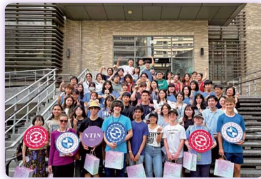
▲ 國際交流活動大合照

此外，在教育部高教深耕計畫、躍升計畫等經費支持下，本校學生與國際友校如捷克馬薩里克大學（Masaryk University, Czech）醫學部語言中心、VR研究中心、美國約翰霍普金斯大學護理學院（Johns Hopkins School of Nursing）、國際醫護學會：美國護理急重症照護學會（AACN: American Association of Critical-Care Nurses）等學術單位進行跨國合作，各系列課程深受家長及學生好評。