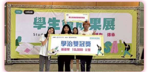
▲ 113年大專院校學生會成果展榮獲「學治雙冠獎」

【學務處】本校學生會參加「113年大專院校學生會成果展」，經過兩天的評選，憑藉豐碩成果和傑出表現，在77所大專院校中脫穎而出，斬獲「學治雙冠獎」佳績。