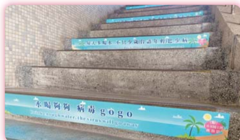
▲ 南護7大樓梯9大健康主題創意標語