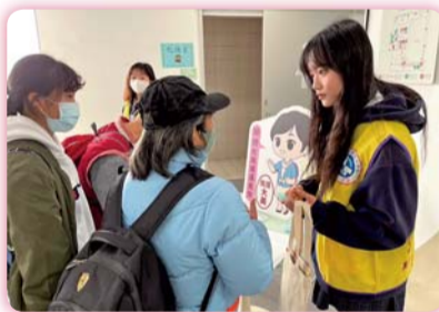
▲ 在校生為未來學生、家長解答疑難