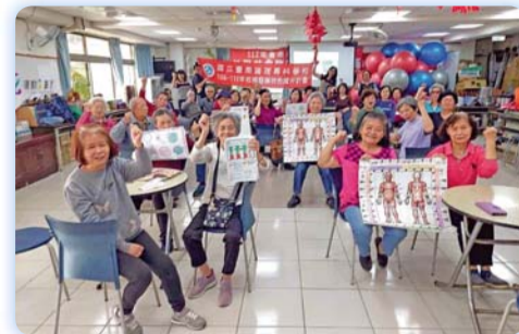
▲「養肌GO GO」桌遊結合營養、運動及健康教育專業，打造出一套全方位的健康促進課程

此款桌遊由護理科教師研發，結合營養、運動及健康教育專業，打造出一套全方位的健康促進課程。課程參與者給予極高評價，許多長者表示經由參加「養肌GO GO」桌遊課程，不僅在日常生活中增加運動量，更對自身的營養攝取有了更深認識；也有長者意識到過往飲食中蛋白質攝取不足，如今則學會如何合理安排飲食，並養成運動的好習慣。課程結束後，甚至有不少長者表示身體質素明顯提升，小腿圍達到合格標準，肌握力也有進步。