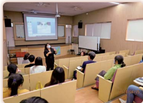
▲同仁參與「職場上的性別關係：談職場性騷擾樣態」專題演講