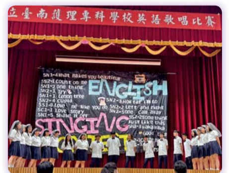
▲ 原班學生載歌載舞