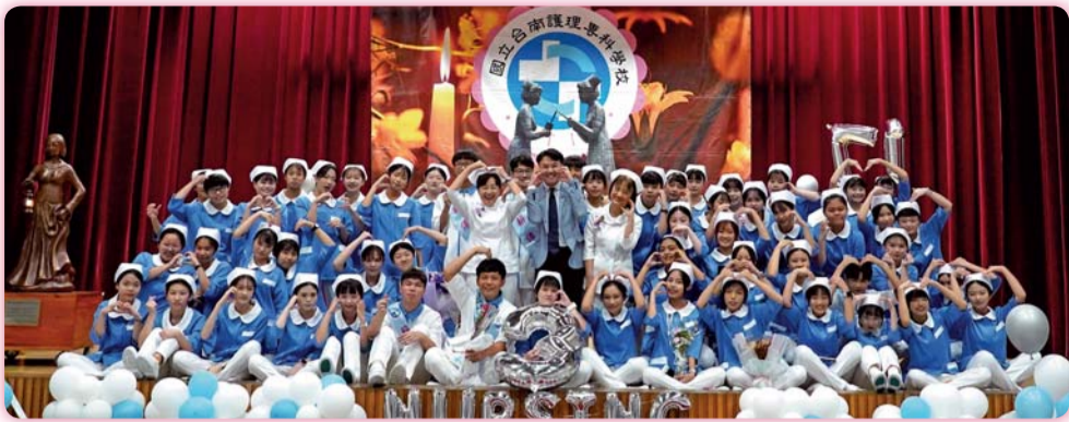
▲ 二年3班加冠生合影