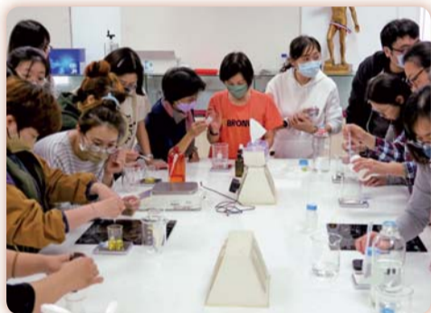
▲同仁參與「手作天然精油乳液」課程

豐富的活動體驗，讓職員們得以藉助芳香自然療法舒緩精神及工作壓力，透過專書導讀看見森林意蘊；另配合性別平等工作法、性別平等教育法及性騷擾防治法之修正，也使教職員悉知修法重點及性騷擾防治之責任。