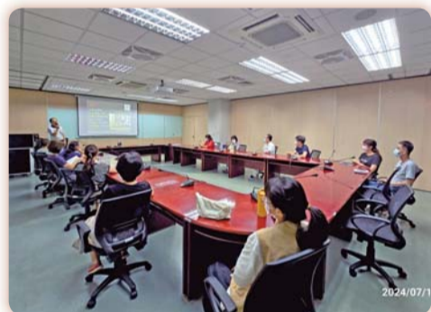
▲同仁參加「走進布農的山」專書導讀會