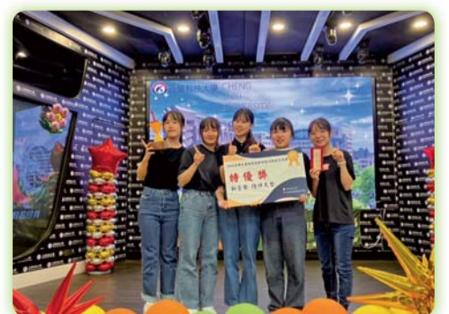
▲ 2024全國大專校院高齡創意活動設計競賽榮獲特優獎