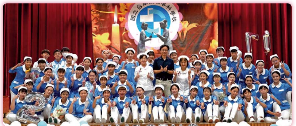
▲ 二年2班加冠生合影