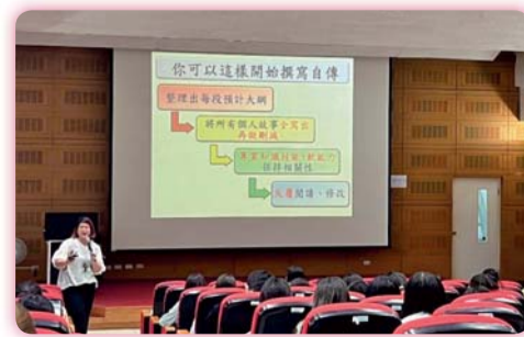
▲ 臺南市政府勞工局派師講授勞動權益