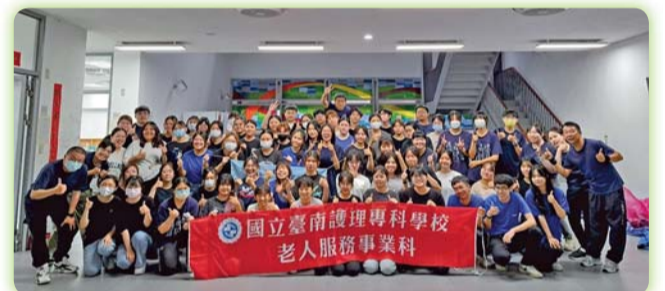
▲ 「初級救護技術員(EMT-1)訓練(初訓)」證照輔導培訓課程