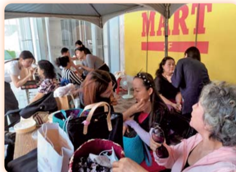
▲學生運用所學為走秀的原住民族長者精心打造專屬的青春回憶妝髮造型