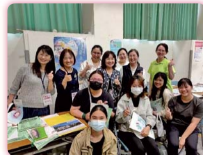
▲ 校園徵才就業博覽會，校長、師生與廠商之合影

【實習就業輔導組】辦理113年高教深耕計畫之「臺南護專校園徵才就業博覽會」，藉由求職求才活動及就業諮詢服務，提供應屆畢業生各機構之職缺、福利、職場權益與就業環境等相關資訊，俾利洞燭機先，提早做好進入職場的準備。