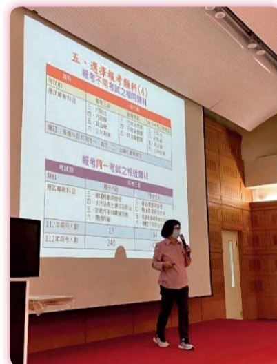
▲ 公職考試報考類科說明

【實習就業輔導組】辦理「準備國家考試必勝策略」講座，邀請考選部劉筆圓參事分享應試策略、公務人員考試及專技人員考試的不同出路和規劃，從中引導學生思考未來的職涯發展。