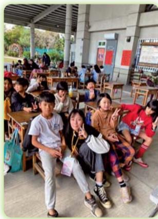
▲ 臺東伊潭部落文化健康站

【老人服務事業科】本科二年級學生於暑假期間將開始進行校外長照機構實習課程，實習前的授徽典禮，一來代表學生已完成並通過校內實作課程；二來激勵學生將往長照領域更進一步，在紮實訓練中面對未來，具備朝著目標邁進的勇氣。