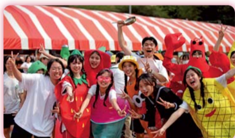
▲ 別出心裁的畢業班變裝大隊接力

熱舞社團、跆拳道隊及班際趣味啦啦舞獲勝隊伍帶來的動感演出，也將南護青春創新的精神表現得淋漓盡致。競賽方面，大隊接力、女子及男子個人100公尺等多項比賽打破大會紀錄，趣味競賽也有破紀錄的捷報，充分顯示學校對運動風氣的培養，成效昭著。