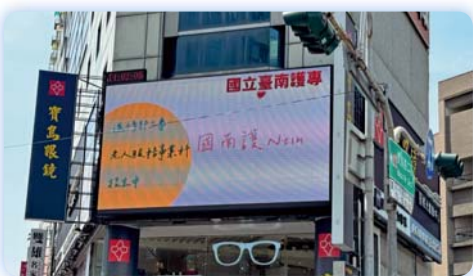
▲ 中山路口寶島眼鏡電視牆