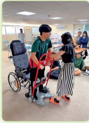
▲ 「多元輔具創造銀髮新生活」參訪活動