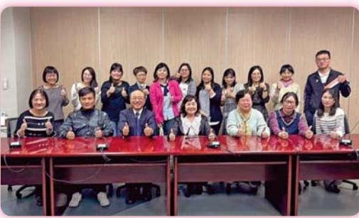
▲ 特色躍升計畫執行成果，展現產研學量能大躍進

此次研討會不僅設置靜態電子海報呈現教師的研究成果，更有研究小組透過簡報分享教學、研究及社會實踐方面的成效。自計畫執行以來，本校致力推動「響亮南護品牌（NTIN x nanhu）」、「躍升產研量能」及「培育長照人才」等三大面向，提供符合長照整體產研需求的量能，紮根研究與產業發展，為社會長照領域的穩健進步貢獻心力。