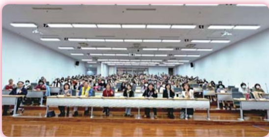
▲ 本校入學說明會參加人數眾多、反應熱烈

【綜合業務組】本校師長戮力於各種升學博覽會、集中宣導、入班宣導共計90餘場，為擴大能見度，113年3月2日自辦之招生說明會也廣獲學生與家長報名參加，頗獲讚賞。同時，為善盡社會責任，本校多次主動走入偏鄉、離島各地區，提供升學資訊、推廣多元化招生，例如：本組前往南投、高雄、屏東、台東等地及原住民重點學校招生，宣導南護培訓之技職專長、弱勢助學及安心就學等措施，學生反應踴躍，展現強烈入學意願。