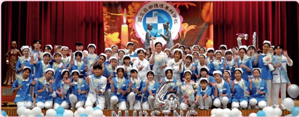
▲ 二年4班加冠生合影