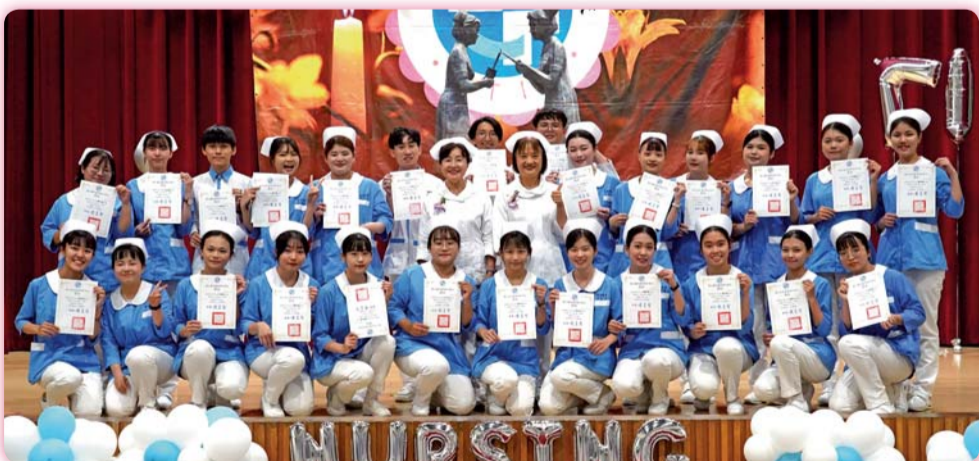
▲ 112學年度護理百合天使

【護理科】為獎勵學生於臨床實習的優異表現，本科訂有護理百合天使甄選辦法，遴選出代表本科實習最高榮譽的護理百合天使。