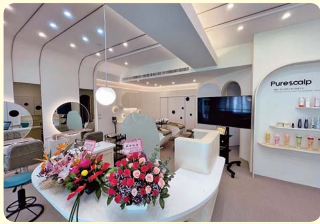
▲ 南護71週年正式啟用「頭皮舒活實習沙龍」

【化妝品應用科】由教育部提升教學設備及校舍補強計畫經費挹注，耗時一年精心打造的「頭皮舒活實習沙龍」於南護71週年正式啓用。這是一個模擬業界的頭皮養護實務，讓學生的專業技術得以實踐的空間。除了教育部資源挹注，與學校合作的實習機構如：昇宏國際企業股份有限公司、堅兵智能科技股份有限公司、佐登妮絲國際股份有限公司等也鼎力支持，捐贈多項實習用品，有效減輕學生負擔。