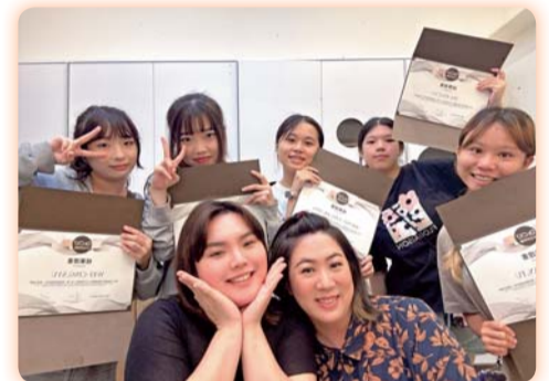
▲首次與佳醫集團(Dr. CYJ)合作，邀請業界專家指導頭皮養護實作技巧，精進二專生實務技能