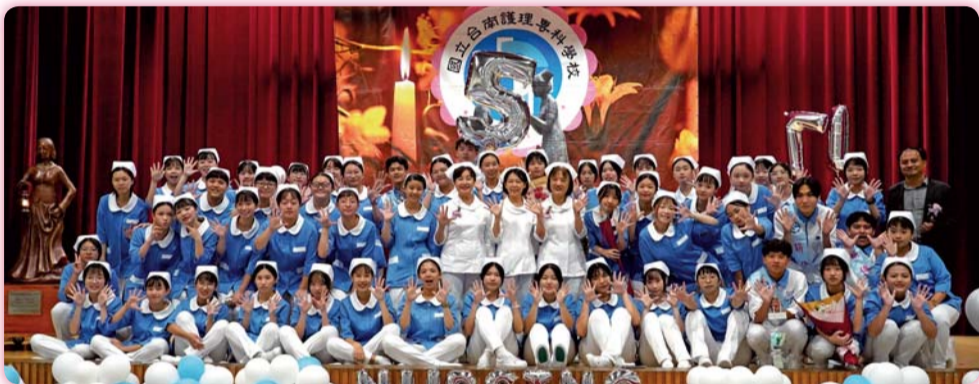
▲ 二年5班加冠生合影