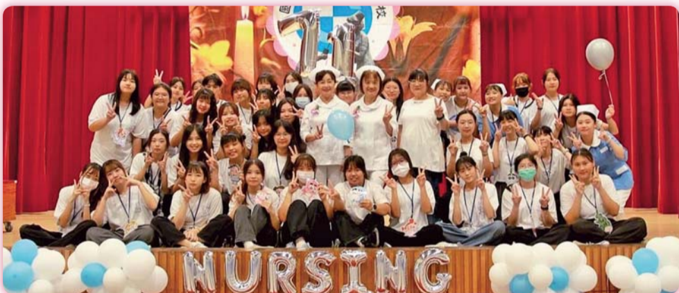
▲ 活動圓滿成功的舵手—第14屆護科會幹部