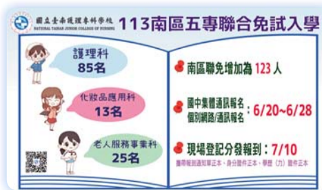
▲ 學校首頁電子看板