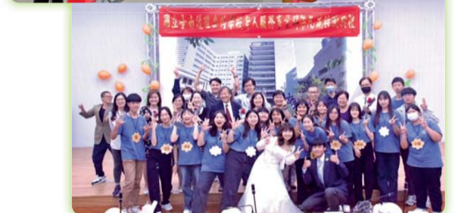
▲ 學生會辦理第九屆授徽典禮