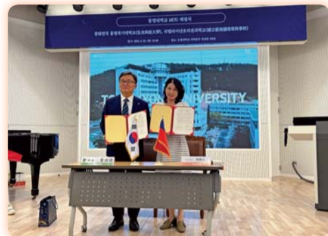
▲與韓國東明大學簽署策略聯盟備忘錄，未來雙方將在美容應用技術進行更多交流與合作

入現代時尚元素，讓走秀長者展現出自信形象和迷人的一面。這項活動不僅是一場展示美麗的舞台，更是學生與年長者之間的文化交流和情感連結的時刻。年輕一代藉此學會尊重、欣賞長者的智慧，長者也同時感受到社會的溫暖和年輕世代的敬重。