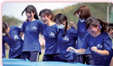
▲ 趣味競賽十人十一腳，同學們齊心協力完成