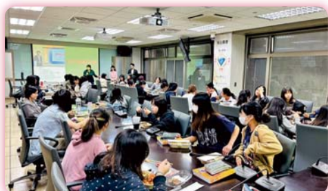
▲「體內環保大作戰」講座中，講師協助師生發現及解決健康問題