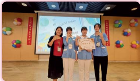
▲ 傳染病桌遊獲全國跨域創意實務能力競賽最佳創意獎