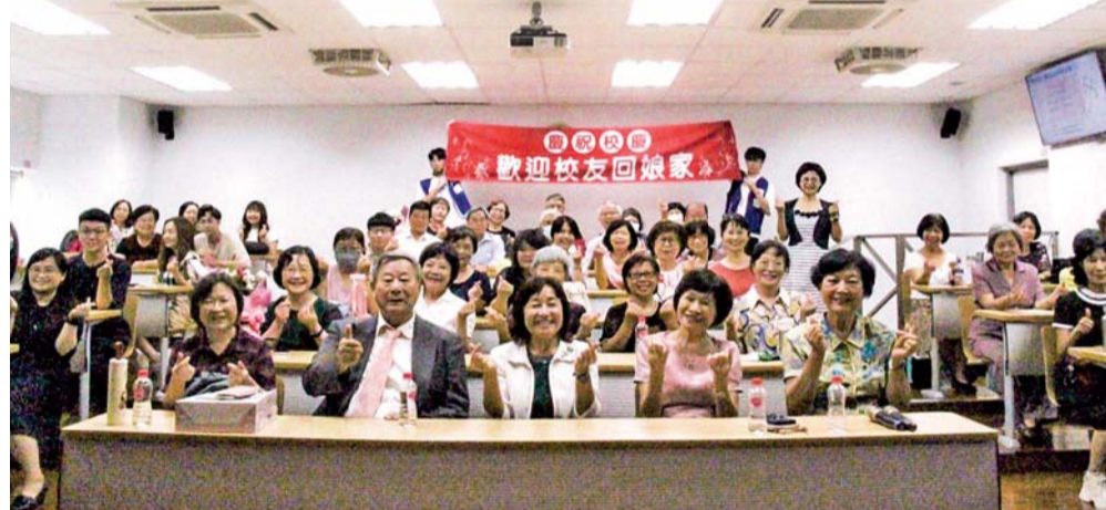
▲ 校長與校友會全體合照