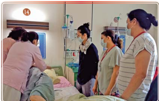
▲ 照顧服務訓練學員至高雄榮總台南分院進行機構實習