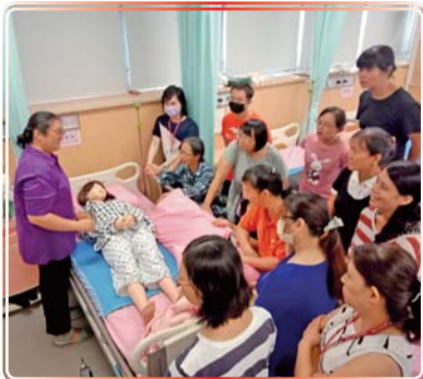
▲ 照顧服務員回覆示教課程