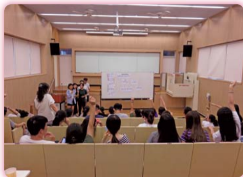
▲英語創新課程-「韓流風」主題活動