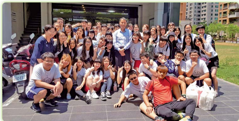
▲ 福樂多 FURUTO 銀髮生活館-參訪活動