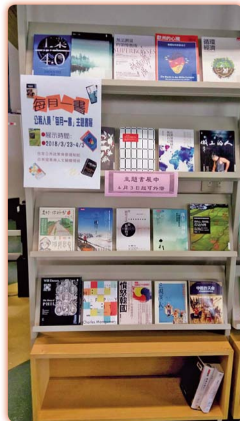
▲ 採購107年度每月一書及舉辦主題書展，推廣專書閱讀活動

料），於活動後由該中心統計提供借閱冊數，借閱率最高前3名者，於公開會議中表揚；期盼透過多項閱讀、寫作、數學位習競賽等活動，激發本校教職員工學習潛能及強化數位學習，營造出樂活學習的校園環境。