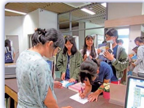
▲ 同學憑學生證登記領取二手書刊