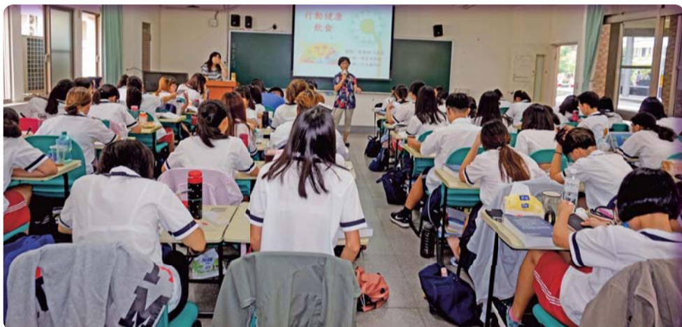
▲ 推動 行動健康飲食，邀請本校兼任營養師入班宣導飲食知識