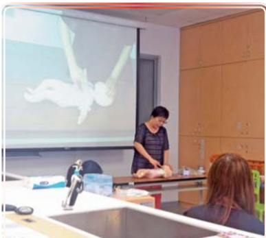
▲ 托育人員班實務授課