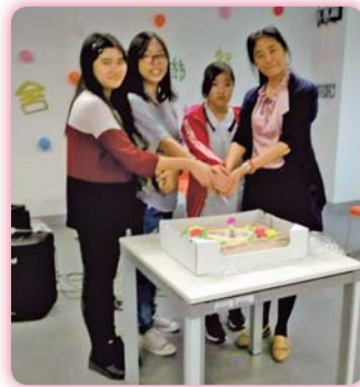
▲學務主任親自主持慶生餐會，一同與壽星切蛋糕同樂