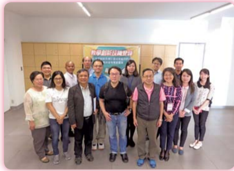
▲創新先導計畫-成果展與期末管考專家會議