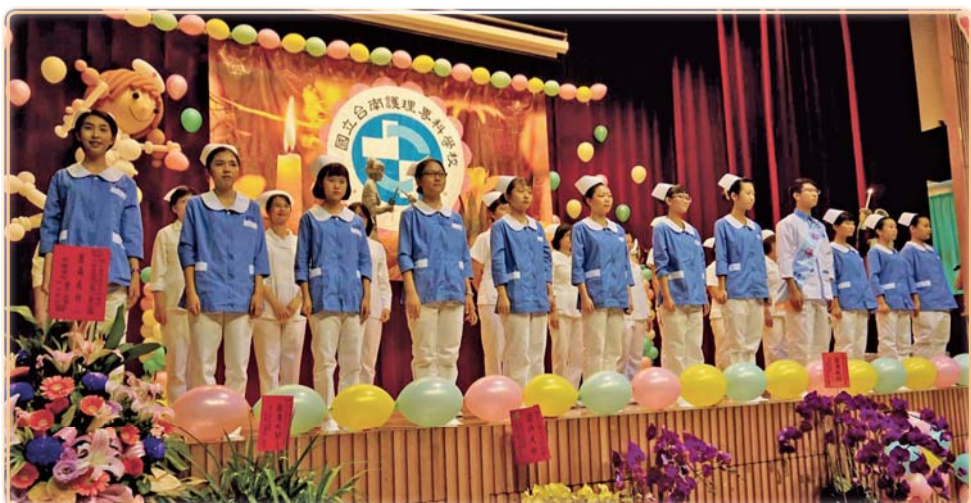
▲ 護理老師們為261名準白衣天使，配戴護師帽及背帶