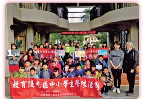
▲耕心與棒球社團聯合營隊