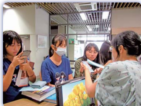
▲ 工作人員自題庫中隨機抽問同學智財權問題