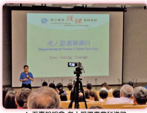
▲ 五專說明會-老人服務事業科進路