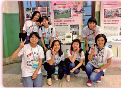
▲ 107.3.25於松山文創園區展攤分享