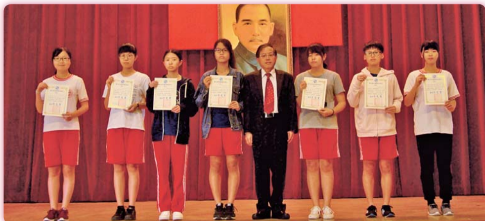
▲全校性集會時校長親臨主持，並頒獎表揚學業成績優良學生