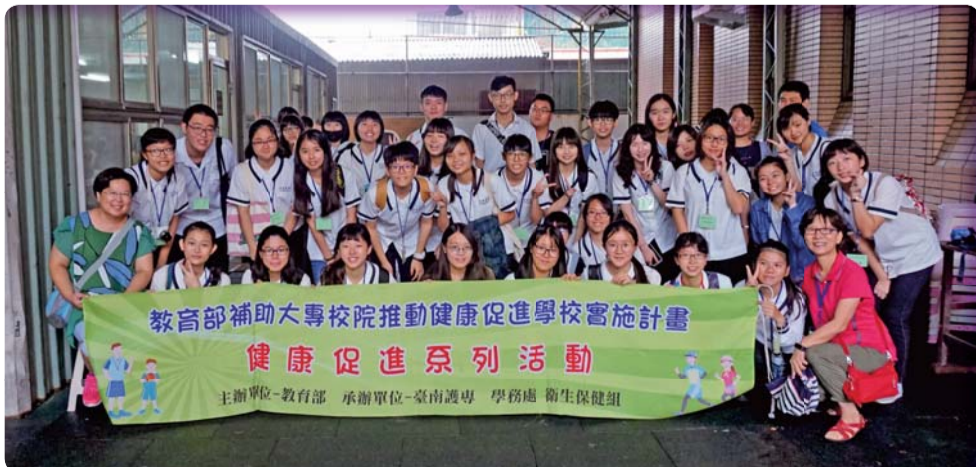
▲ 結合老人服務事業科一起辦理社區健康檢測服務，服務他人成長自己