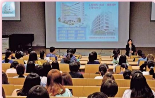
▲ 為讓學生了解合作醫院福利制度，特邀醫院護理主管前來說明

自103年起迄今，本科5+2技優生考取「護理產學合作專班」累計人數已達85人；這些同學雖一邊工作一邊讀書，仍表現不俗，深獲合作醫院護理主管讚揚。