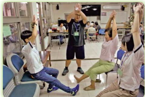
▲ 學生至社區替長輩做體適能檢測