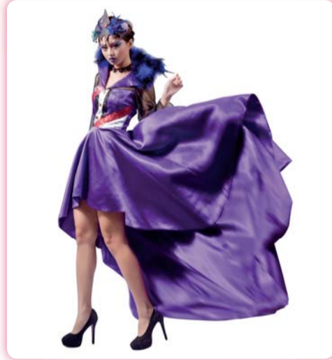
▲ 創作主題：分裂 (Psychopath)

本次活動更邀請國立北斗高級家事商業職業學校、國立嘉義高級家事商業職業學校、高雄市立三民高級家事商業職業學校、嘉義市私立東吳高級工業家事職業學校及臺南市私立崑山高級中學等5所高中職，共380名師生蒞校觀摩畢業成果發表、校園導覽及科簡介。透過活動展現本科教學特色與全新世代化妝品應用概念，在全科優秀師資團隊的帶領，配合完善學習環境設備及全國的美容技能檢定證照的高通過率的表現，持續朝向積極、樂觀、希望的前景邁進。