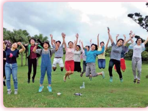
▲ 充滿熱忱與青春洋溢的臺東鼓舞志工團