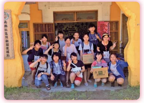
▲ 志工團於關懷據點服務完合影