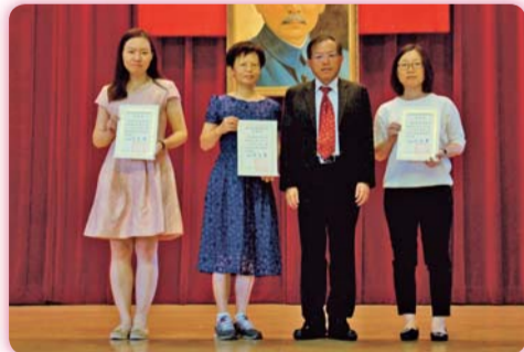
▲全校性集會時校長親臨主持，並頒獎表揚整潔優良班級導師