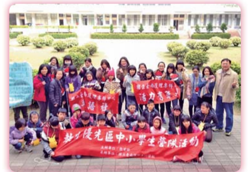
▲活力有氧與手語社團聯合營隊