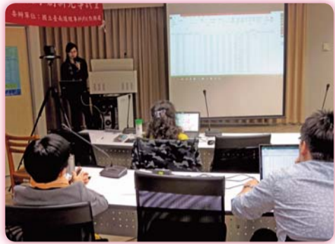
▲大數據 微創新-實體與線上工作坊