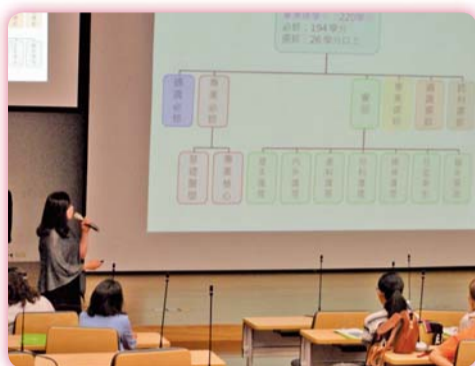
▲ 五專說明會-護理科進路