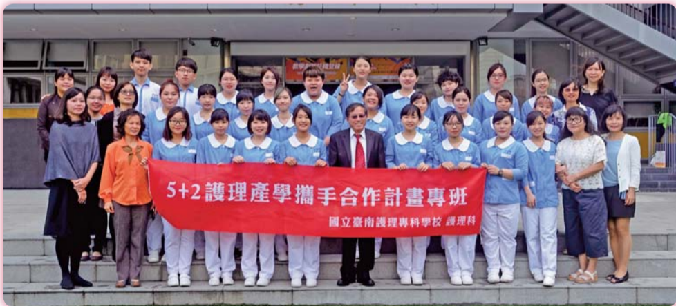
▲ 106學年度技優生放榜後開心合影