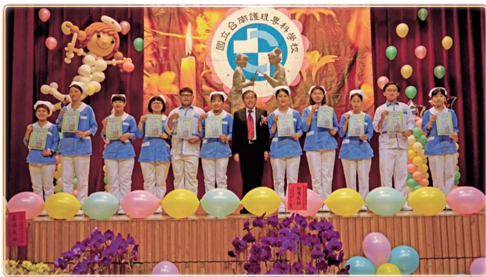
▲ 護理百合天使表揚