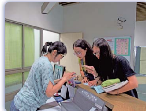
▲ 工作人員指導學生下載使用電子圖書