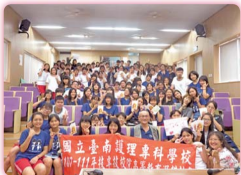
▲英語創新課程-「勇敢人生-生命色彩」講座