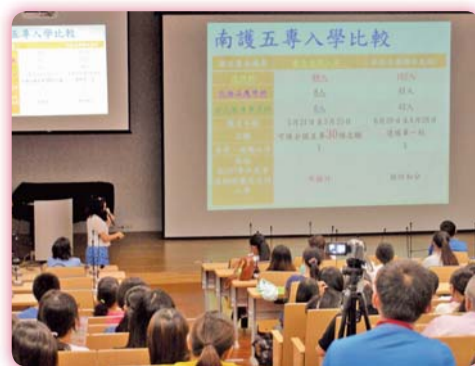
▲ 五專免試入學積分採計之計算說明