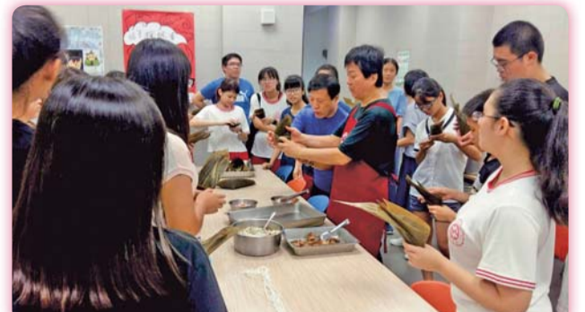
▲因應端午節住宿生親身體驗包粽子樂趣