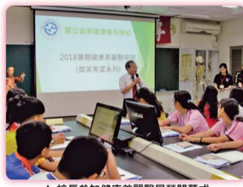
▲ 校長參加健康美麗醫學營開幕式

四、依教育部107年3月27日臺教技(一)字第1060182630號函，本校二專夜間部老人服務事業科自108學年度停招。