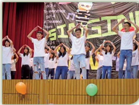
▲ 英語歌唱比賽活動花絮