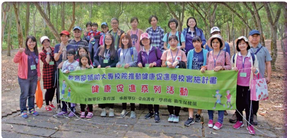
▲ 107年度「健康續航 熊介讚」健康促進種子教師培訓，體驗健走、喝水及視力保健技巧

2、天天運動30分鐘、無糖白開水等健康促進行為；配合生活輔導組推動健康餐飲及無碳飲食，邀請本校兼任營養師入班倡導「行動健康飲食」，讓健康飲食概念深化日常生活之中。社區行動醫院本學期共4場，結合社區辦理健康服務，讓學生有機會服務他人，成長自己，服務臺南市社區民衆1,401人。與本校老人服務事業科合作，協助社區長輩健康基礎測量及體適能檢測服務1場；共18名長輩完成檢測，過程中民衆也相當肯定學生的專業及態度，學生更在實務服務中更能體認健康維護的重要性，並將所學回饋社會。