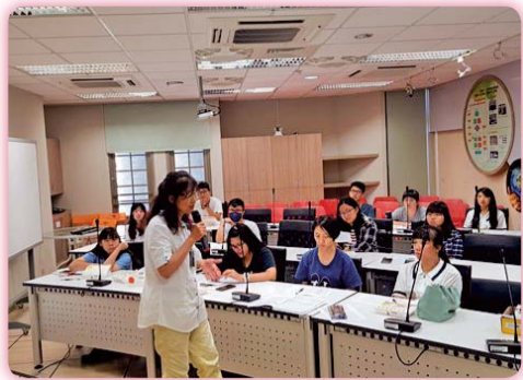
▲「提升全校英語能力」會議