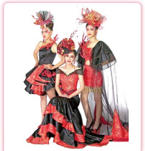
▲ 創作主題：囍 (Festive)