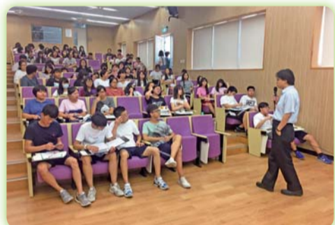
▲ 5月「高齡社會與銀髮創新」專題演講

人服務的設計。今年結合社會工作實習，納入健康老人、家庭照顧老人、保護性老人、機構服務、居家服務等各種類型，安排機構也遍布全臺，東到花蓮北至基隆南至屏東，讓學生進入各種首屈一指的服務單位學習各種技術與專業。除了了解老年人服務的多元性與多樣化，包括家庭服務、照顧者服務、社區服務、機構服務，更強化學生在不同專業間的合作學習，如透過職能治療、照顧服務、社會工作等跨專業合作機會，具體的了解老人服務在臺灣發展的真實面貌。未來在課堂中，我們更需要將孩子的觀念進行引導，尤其在認識到老年服務需要家庭、社區與社會共同協助的條件下，能夠願意扶養照顧自己的父母，也願意生養下一代，扶持一個健康和諧老化、親代共同照顧的老人福利國願景。