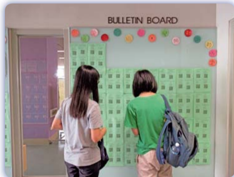
▲ 同學自行掃描QR code下載電子圖書

使用正版電子圖書，並藉由簡單的智財權快問快答、二手書刊贈送、智財權主題書展等，透過互動式遊戲，幫助師生瞭解智財權基本概念及重要性，建立正確智財權價值觀。