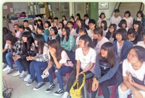
▲ 和欣護理之家-參訪由機構人員帶來精彩的簡報，學生們亦專心聆聽並適時提問