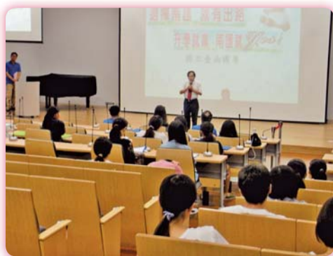
▲ 校長參加本校五專說明會開幕式

三、本校辦理兩場五專入學說明會及健康美麗醫學營，透過參觀校園及各科的體驗活動使準新生及社會大眾更了解本校的文化及特色。