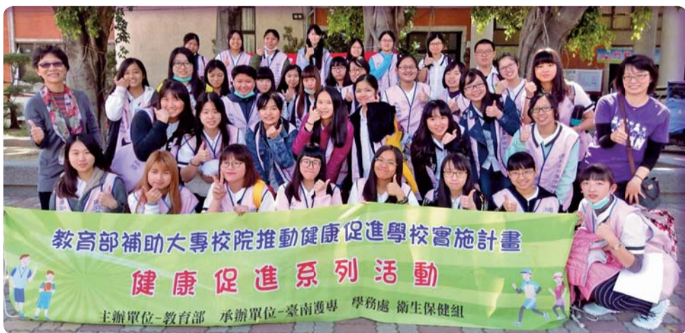
▲ 保健服務志工參與行動醫院，獲衛生單位（局、所）及社區民衆讚賞