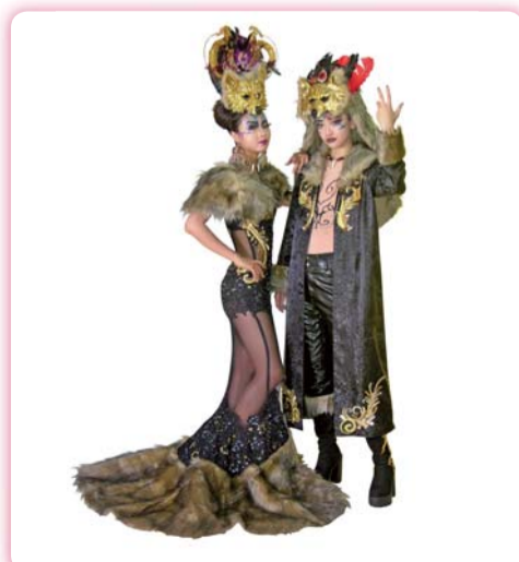
▲ 創作主題：天黑請閉眼 (Killer)