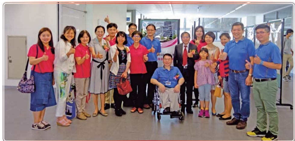
▲ 106學年度校內專題研究海報發表展覽