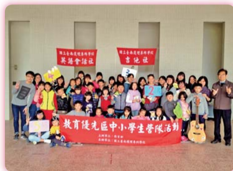
▲英語會話與吉他社團聯合營隊