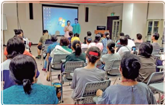
▲ 照顧服務員實務授課

學員至醫院實習照顧老人，在醫院的護理人員及照顧服務員親自指導下，學員認真學習，反應熱烈，收穫滿滿！托育人員訓練的課程，除教授照顧嬰幼兒的相關知識，亦讓學員於實驗課中學習實驗操作小兒CPR、嬰兒洗澡、餵食、遊戲等相關技巧，以提升學員的實務經驗，效果卓越。