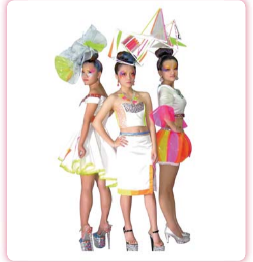
▲ 創作主題：鑲·鏡 (Mirror Image)