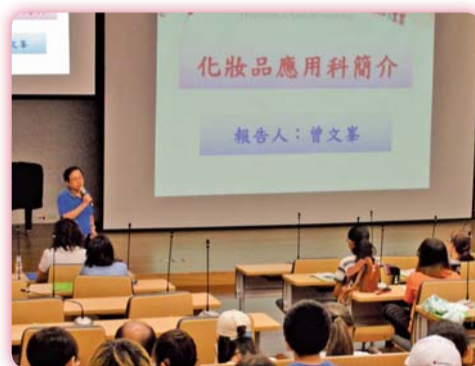
▲ 五專說明會-化妝品應用科進路