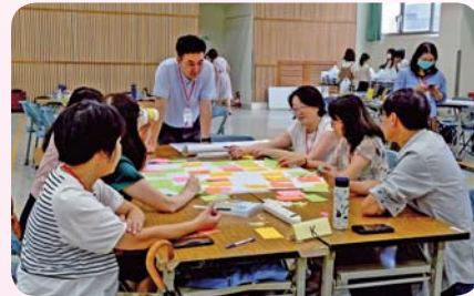
▲ 教師進行分組討論

【教務處教發中心】為提升專科學校課程設計與教學實踐品質，教務處教師發展中心於 114 年 7 月 10 日至 11 日在本校承辦教育部「專科課程教學精進工作坊」。教務處全體同仁、秘書室、總務處事務組與保管營膳組，以及圖書資訊中心資訊組全力支持前置作業與現場設備管控，確保活動順利完成。此次工作坊邀集全國各專科學校校長、教務主管及教師共 84 人參與，展開為期兩日的專業研習與深度交流。課程內容包含主題講座、實作演練與分組討論，聚焦教學創新、課程規劃與學習成效等核心議題，旨在強化專科教育的實務導向教學策略，協助教師精進教學設計與課堂執行能力。