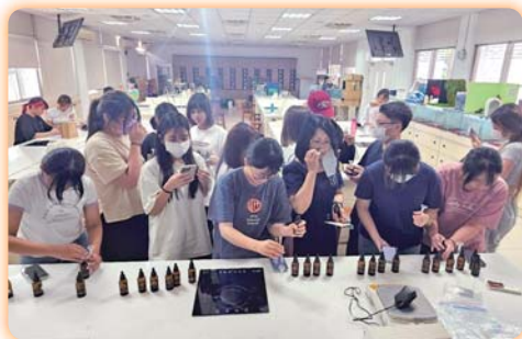
▲「靈數香氣專屬精油滾珠瓶調製工作坊」融合生命靈數與植物化學、個性與香氣頻率，調製專屬自己命數能量的精油滾珠瓶