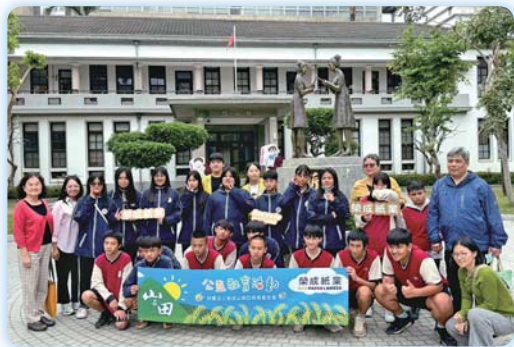
▲邀請南投縣民和國中師生到校參加五專新生體驗活動

【綜合業務組】教務處與五專各科於 114 年 3 月 8 日舉辦五專招生說明會，黃美智校長親自到場勉勵考生，現場氣氛熱絡溫馨，參與人數踴躍。此外，本校師長更全力投入，全台奔走參與各國中升學博覽會、集中宣導與入班說明，場次累計逾 90 場，為學子升學之路點亮明燈。國南護不僅用心招生，更關懷每一位學生的未來與機會。師長們多次主動走入偏鄉與離島，將升學資訊送到國中生手中，推廣多元入學與安心就學政策，殷許夢想不受地理限制。本學期特別邀請南投縣民和國中原住民族師生參加五專體驗營，實地體驗本校技職專長、助學資源與就學扶持。活動中，學生展現濃厚興趣與高度入學意願，並在結束後親手製作感謝卡，讓全體師長深受感動。