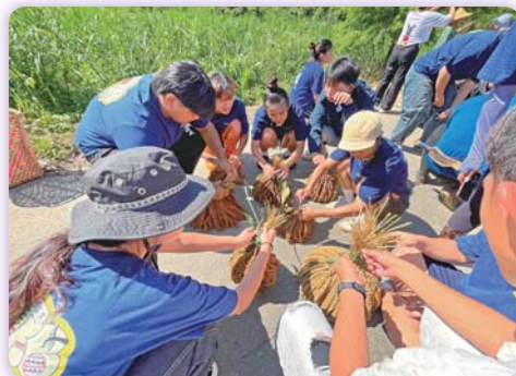
▲ 體驗小米收穫祭：採收及綁小米