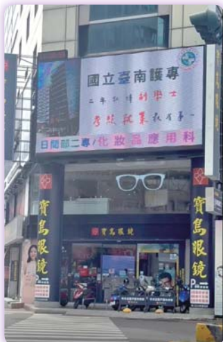
▲寶島眼鏡電視牆廣告