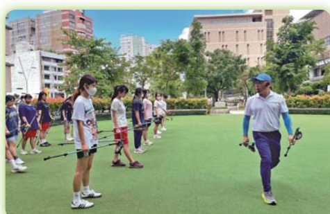
▲辦理「ONWF 北歐式健走銅級領導員認證課程（銅級指導員）」證照輔導培訓課程