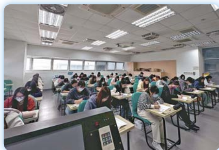
▲學生專注進行英語檢測