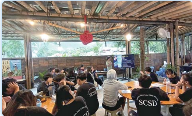
▲ 返鄉青年分享其於部落創業的歷程及困境