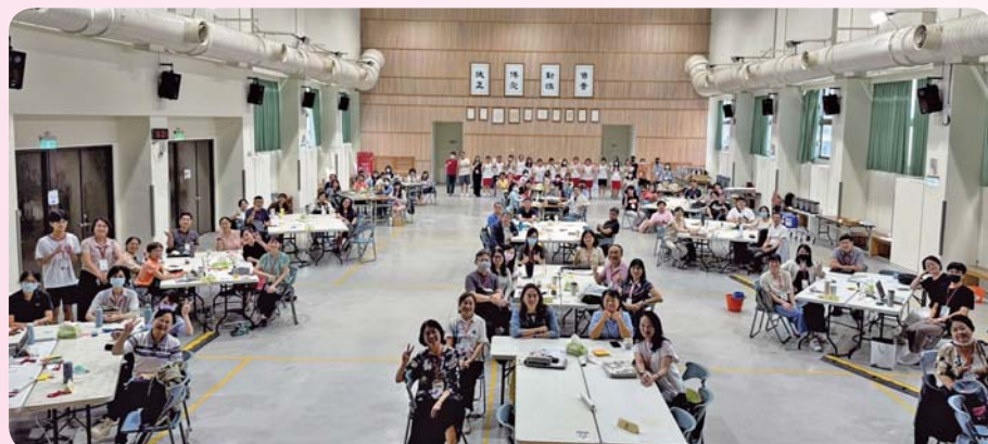
▲ 承辦教育部「專科課程教學精進工作坊」