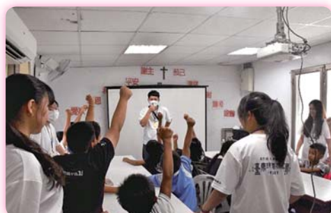
▲大哥哥、大姊姊深獲方舟教室兒童的喜愛