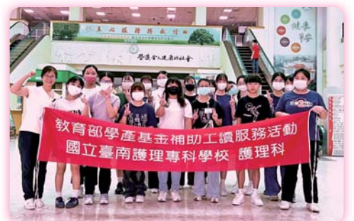
▲城南日照中心師生合影