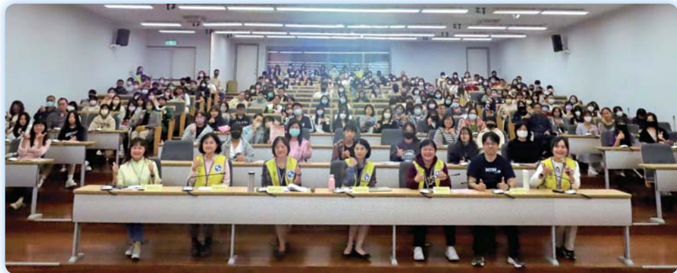
▲本校入學說明會參加人數踴躍