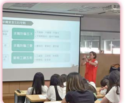
▲ 就業求職系列講座