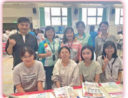
▲ 114 年高等深耕教育計畫之南護校園徵才就業博覽會