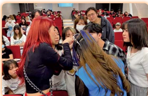
▲透過業界專家技術示範講座，學生得以更貼近實務，深入了解美髮工作的操作流程