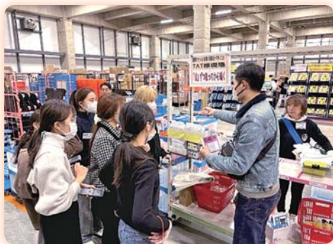
▲學生在日本最大美甲企業 TAT 實習，學習市場營銷、產品製作、美甲護理及倉庫管理出貨