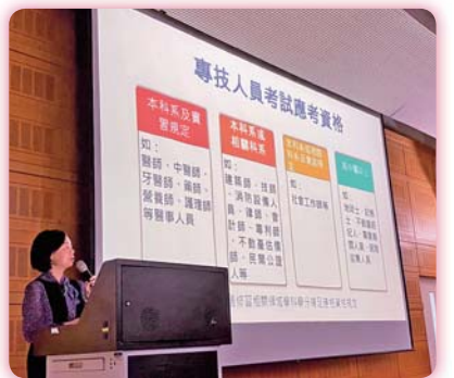
▲ 「準備國家考試必勝策略」講座