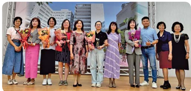
▲ 傑出校友頒獎暨獻花合照