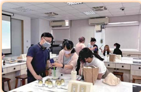
▲「三合一水水霜調製實作工作坊」從科學到溫度，不只是學調製乳霜，同時也學會如何用科學的手與感性的心，調出屬於肌膚的療癒配方