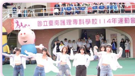
▲ 114 年運動會開幕典禮舞蹈表演

【體育運動組】本校於 114 年 3 月 29 日舉辦創校 72 週年運動會，全校師生熱情參與，士氣沸騰。開場由街舞社、韓流社、韓舞社及老服科二年二班帶來精彩舞蹈，為活動揭開青春洋溢的序幕。競賽部分，今年特別新增個人 200 公尺項目；同時，女子 400 公尺接力、女子 800 公尺及男子跳遠等項目更打破大會紀錄，充分展現學生不斷超越自我的實力與風采。當日師生齊聚一堂，共享這場融合運動、歡樂與榮耀的盛典，不僅激發團隊精神，也為校園生活留下難忘回憶。