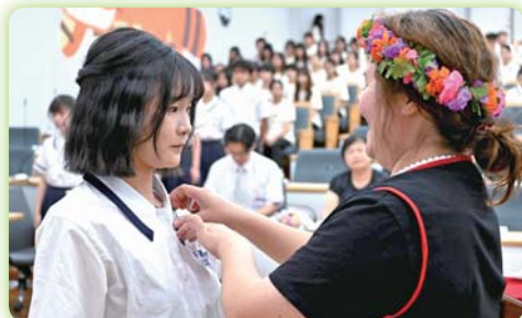
▲老人服務事業科第十屆授徽典禮 (1)