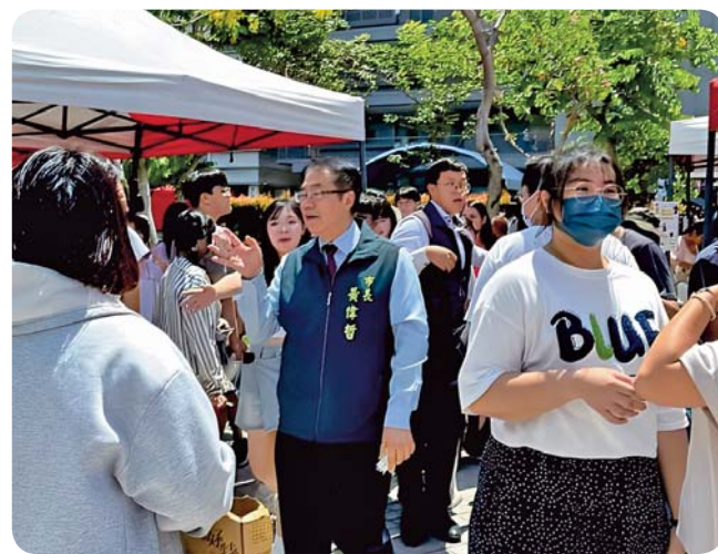
▲ 台南市長黃偉哲與學生互動熱烈