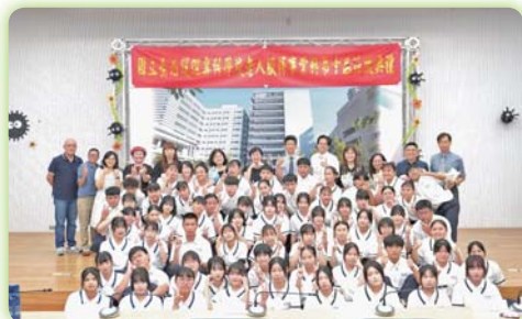
▲老人服務事業科第十屆授徽典禮 (2)