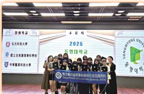
▲學生參與韓國釜山東明大學妝髮造型海外研習營，學習最新的彩妝造型美容技術，並取得研習證明