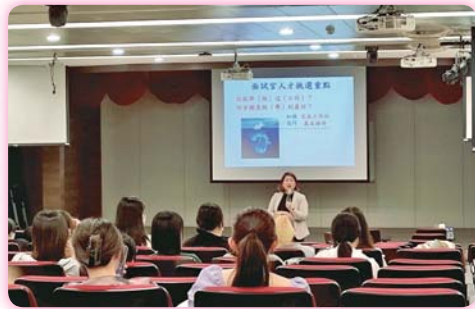
▲「履歷及書審資料撰寫技巧」講座