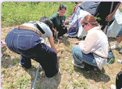
▲ 原住民與非原住民一起種植原住民傳統作物「刺蔥」

【原住民族資源中心】本次活動融合文化探索與生命教育，帶領學生展開一場「回家」之旅。透過介紹布農族歷史習俗、小米信仰、神話傳說與禁忌等多元內容，學生不僅深入理解傳統智慧與生活哲學，更體會族群文化與土地間深刻的連結。在活動過程中，學生親身參與布農族傳統收穫祭儀，體驗手工採收與綁小米，並製作象徵祝福的菖蒲項鍊，感受布農族與自然共生的智慧。同時，也走訪山胡椒學習基地，踏查布農族充滿歷史軌跡的傳統領域「內本鹿」。此外，活動特別安排「東布青」返鄉青年分享實踐經驗，啟發學生思考如何結合專業與部落需求，探索返鄉服務或創業的可能。這場文化巡禮不僅增進學生的文化知識、情感共鳴與自我認同，更激發對多元文化的尊重與理解。