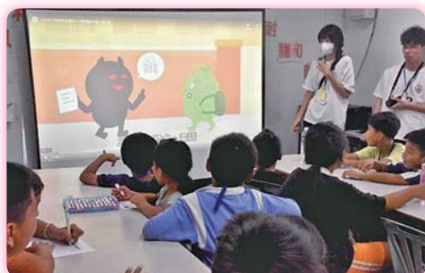
▲志工們精心設計每一場教學活動