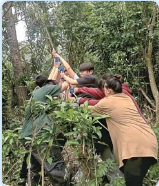
▲ 部落傳統領域探索：採黃藤

【原住民族資源中心】結合校內「原鄉發展與實務規劃」課程，本活動以沉浸式、多元化與創新為核心理念，帶領原住民族學生走進部落，從文化根源出發，探索原鄉創生的潛力與未來發展的可能。學生並與返鄉青年面對面交流，親身體驗部落創業、文化復振與社區發展的實踐歷程。活動中，返鄉青年分享自身創業經驗與文化推廣志業，勾勒原鄉藍圖。透過真實互動，學生不僅深化對原鄉的理解，更激發對多元職涯的想像與回饋部落的熱情。這趟探索之旅，不僅提供寶貴的學習經驗，也喚起學生對原鄉創生與文化永續的關注，為未來部落發展注入新的希望與能量。