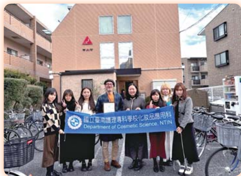
▲本科師生與株式會社 TAT 社長合影

【化妝品應用科】為拓展專業技能、促進跨文化交流與增廣國際視野，本校辦理「國際美甲產業專業人才培育計畫」，與日本最大美甲企業一株式会社 TAT 合作，安排學生赴日進行短期專業實習。株式会社 TAT 為跨國美甲專業集團，具業界領導地位，此次合作為學生提供寶貴的國際學習機會。實習自 114 年 1 月 13 日至 2 月 16 日展開，學生於 TAT 市場營銷部、產品製作部與美甲教育部等單位接受專業訓練，內容涵蓋指甲護理、美甲實作、門市經營、倉庫管理與出貨實務。同時，計畫安排企業交流，包括參訪日本專業美甲學校、隨行行銷幹部視察店鋪，並與當地美甲師面對面交流。透過此次海外實習，學生不僅精進美甲專業技術、深化對日本美甲產業的理解，更在學習日文的同時，體驗日本人嚴謹的專業態度與美業服務精神，培養多元國際視野。