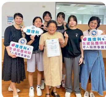
▲ 學姐妹「大手牽小手活動」合影