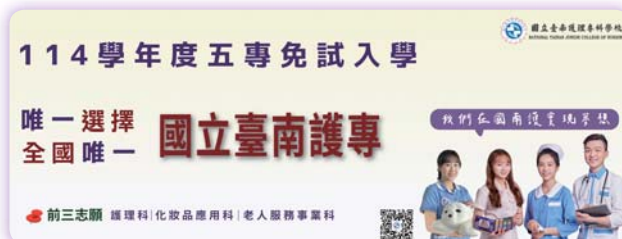
▲學校首頁電子看板隨時更新