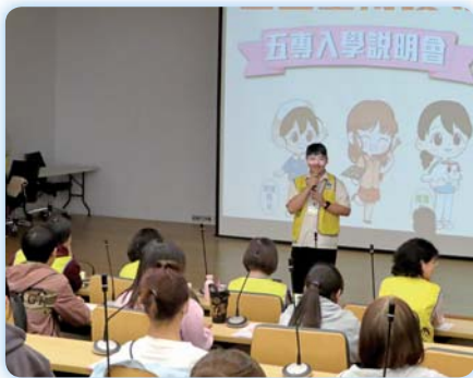
▲學長上台分享入學本校就讀之經驗